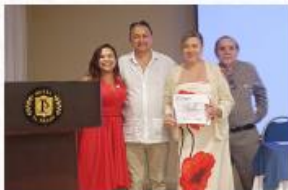
• UR Atlántico