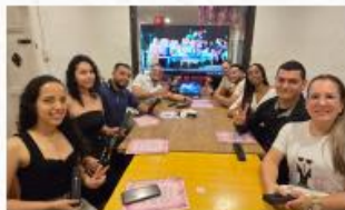
• Llanos Orientales