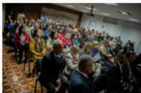
• UR Bogotá y Cundinamarca