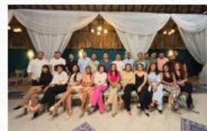
• UR Sucre