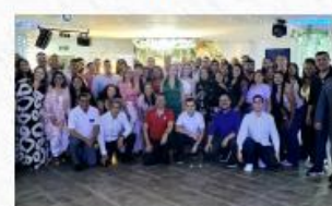
• UR Valle del Cauca